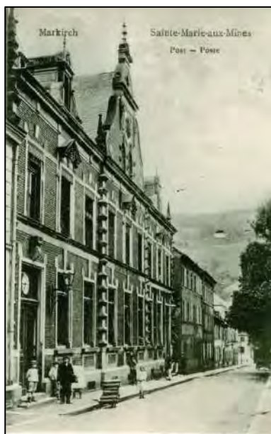
Rue Narbey et poste de Sainte-Marie-aux-Mines - 1903

La poste et le lycée (bien que ce dernier ait été construit en conservant un style architectural très français) datent également de cette période. C'est également sous administration allemande qu'est percée la rue Osmont.