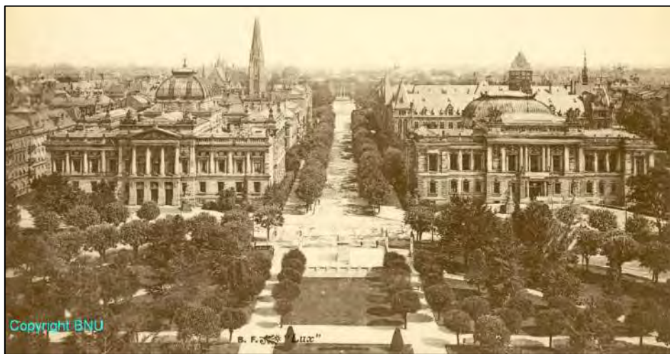
La Neustadt strasbourgeoise à l'époque de l'annexion allemande.

De 1871 à 1918, l'Alsace appartient à l'empire germanique. L'Annexion est une période plutôt prospère pour l'Alsace, notamment sur le plan de l'urbanisme et de l'architecture. Strasbourg, désignée comme capitale du Reichsland , est considérablement étendue et de nombreux quartiers, dont la Neustadt , voient le jour.