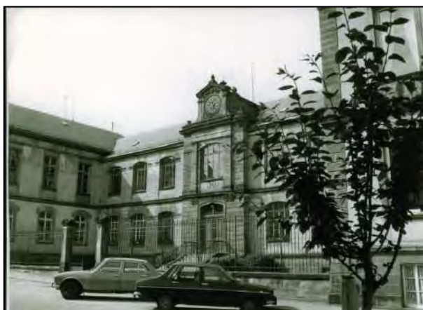
Lycée Louise Weiss à Sainte-Marie-Aux-Mines - - vers 1970-1980

L'annexion est donc pour l'Alsace, et particulièrement pour Sainte-Marie-aux-Mines, une période importante de modernisation et d'extension urbaine.