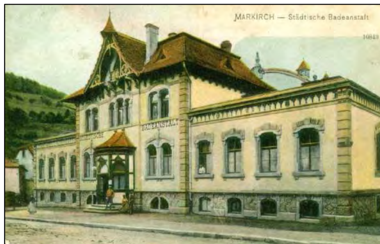
Bains municipaux / Piscine municipale de Sainte-Marie-aux-Mines - - vers 1903-1914

La poste et le lycée (bien que ce dernier ait été construit en conservant un style architectural très français) datent également de cette période. C'est également sous administration allemande qu'est percée la rue Osmont.