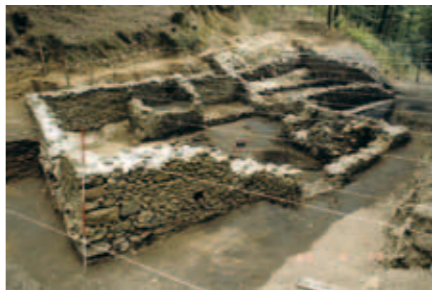
Carreau de la mine Samson à Sainte-Croix-aux-Mines. Les fouilles ont permis de déblayer entre autre l'ancienne forge.

Les recherches spéléologiques et archéologiques dans les mines locales ont connu un essor sans précédent dans les années 1970 et 1980. Aujourd'hui encore, deux acteurs animent des campagnes de fouilles annuelles : l'Association Spéléologique pour l'Etude et la Protection et l'Etude des Anciennes Mines (ASEPAM), qui organise des chantiers sur les anciens secteurs du Neuenberg et de l'Altenberg, et le Centre de Recherches Archéologiques des Mines et de la Métallurgie (CRAMM), qui organise des fouilles archéologiques sur le site minier du carreau Samson. Enfin, le Val d'Argent dispose des infrastructures nécessaires pour la collecte et la diffusion des connaissances sur l'exploitation des mines. Installée dans les locaux de l'ASEPAM, la bibliothèque de la Fédération du Patrimoine Minier compte plus de 3000 ouvrages et articles sur l'histoire des mines.