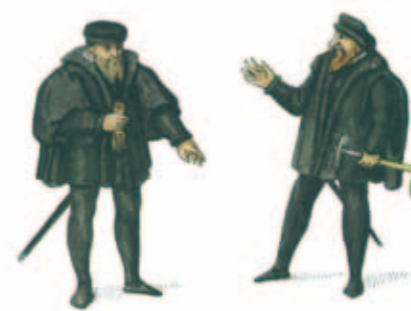
Le juge des mines intervenait dans l'ensemble des affaires minières et dans le partage des concessions. Il était assisté de plusieurs directeurs techniques, de greffiers et de percepteurs des dîmes.

La Guerre de Trente Ans et le passage des troupes suédoises en 1635 stoppent provisoirement l'exploitation des mines. Celles-ci sont remises en activité après la guerre et on obtient encore périodiquement de bons résultats au cours du 18 ème siècle grâce à l'extraction du cobalt. Utilisé pour la fabrication de colorants et dans la décoration des poteries, il fait travailler quelques dizaines de mineurs vers 1740. A cette époque, l'industrie textile prend la relève mais certains filons sont encore exploités par intermittence jusqu'au 20 ème siècle.