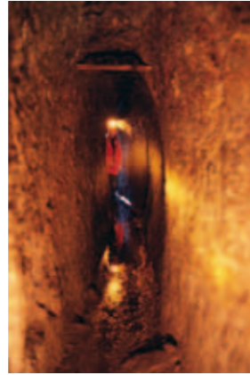
Galerie typique du 16 ème siècle, mine Saint-Louis Eisenthür, massif du Neuenberg.

Ce patrimoine consiste essentiellement en des travaux miniers souterrains et de surface réalisés par les mineurs. Parmi les grandes périodes de l'histoire des mines de Sainte-Marie-aux-Mines, le 16 ème siècle occupe une place à part, prépondérante tant par l'importance des travaux entrepris que par le haut degré technologique des exploitations.