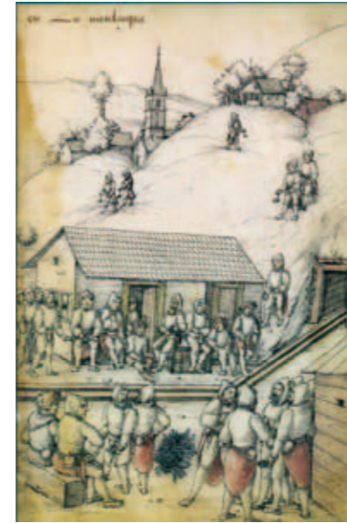
Les mineurs, équipés d'un cuir fessier, d'un marteau et d'une pointerolle, attendent d'entrer dans la mine où ils partent pour 8 heures de travail. Ouvrage d'H.Groff, 1529.