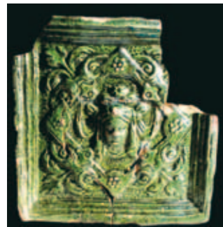
Un carreau de poêle. Chaque carreau est unique et présente les symboles de la société minière.

De cette présence des mines, persistent encore des traditions, au travers de la Caisse des Mineurs par exemple. Au 16 ème siècle, les mineurs paient chaque semaine une cotisation, correspondant à 1/100 ème de leur salaire. L'argent ainsi récolté permet de venir en aide aux malades, aux invalides, aux veuves et orphelins, aux nécessiteux, de rétribuer un instituteur et un pasteur. Bien que les mines ne soient plus en activité, la Caisse des Mineurs, ayant son siège à la Tour des mineurs d'Echery, existe encore de nos jours. Elle ouvre notamment les défilés protocolaires lors des manifestations patriotiques (fête nationale, 11 novembre...).