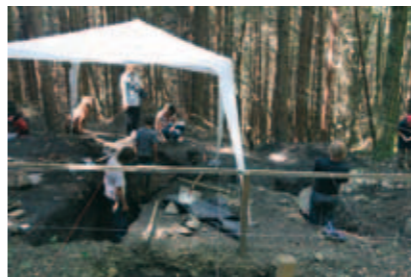
Chantier de fouilles de l'ASEPAM en 2007 sur le secteur de l'Altenberg.

Les sites miniers en surface et en souterrain sont des sites archéologiques réglementés par la loi du 27 septembre 1941. On ne peut y effectuer des fouilles ou des sondages sans autorisation préalable. De même, toute découverte d'ordre historique ou archéologique doit être déclarée immédiatement en mairie. Cependant, les mines n'ont pas été épargnées par les méfaits du pillage de minéraux dans les années 1960-1970. Les spéléologues de l'époque n'avaient pas conscience de la fragilité de ce patrimoine. Reconnu pour son importance historique et archéologique, le secteur du Neuenberg a alors été inscrit à l'inventaire supplémentaire des monuments historiques en 1994.