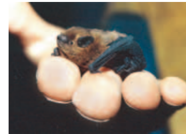
Exemple de pipistrelle commune. Les chauves-souris, présentes dans les galeries des mines sont des animaux fragiles, qu'il ne faut pas déranger afin de les préserver.

Depuis l'abandon des exploitations, les anciennes mines servent aussi de refuge à une faune fragile comme les salamandres, les araignées qui se nourrissent des insectes aux entrées de mines, ou encore les chauves-souris. Les « hirondelles de la nuit » hibernent de décembre à mars, de préférence dans les cavités souterraines ou les anciennes galeries de mines. Plusieurs espèces viennent s'y réfugier, notamment le grand murin et différents vespertiliens. Cette présence est un atout remarquable pour le Val d'Argent, qui est d'ailleurs reconnu par les associations de sauvegarde de la nature comme un site particulièrement riche en chiroptères.