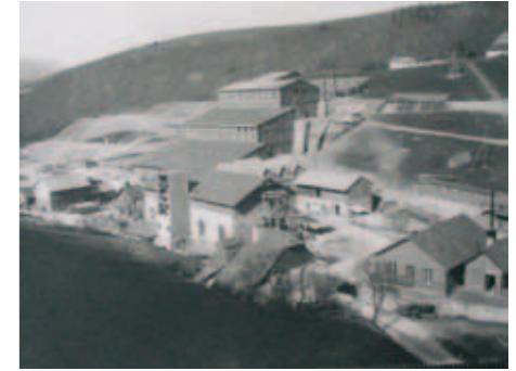
L'usine de traitement de minerais construite par les Allemands dans le Raenthal, ne fonctionna qu'une dizaine d'années.