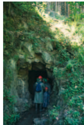
Groupe de visiteurs entrant sous terre. Casque et ciré sont indispensables.

Quatre mines se visitent à Sainte-Marie-aux-Mines : - La mine Saint-Barthélemy, située en centre-ville : elle date du 16 ème siècle et se parcourt sur 100 mètres. - Dans le massif du Neuenberg, la mine Saint-Louis-Eisenthür : ses galeries se déploient sur plusieurs kilomètres. Le réseau ouvert au public s'étend sur environ 750 m et offre un panorama complet des techniques minières du 16 ème siècle. - La mine Gabe-Gottes exploitée durant le 16 ème siècle, fut sporadiquement en activité jusqu'au 20 ème siècle. Tous les types de creusement y sont présentés. - Dans le vallon de la Petite Lièpvre, Tellure présente la mine St Jean Engelsbourg au travers d'une exposition-spectacle.