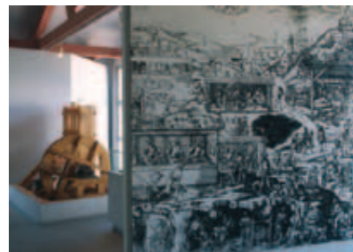
Reconstitution d'un bocard permettant de broyer le minerai à la Maison de Pays.

Longtemps méconnu, le patrimoine minier bénéficie, depuis plus de 20 ans, de recherches et d'une protection.