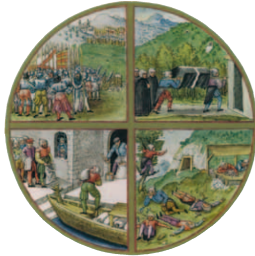
Le Schwarzerbergbuch (1556) : 4 choses qui nuisent à l'exploitation : la guerre, la peste, la cherté des denrées, le désintéret.

Le Val d'Argent fut pendant 10 siècles le théâtre d'une intense activité minière. La découverte de filons argentifères remonte traditionnellement au 10 ème siècle. Elle est attribuée aux moines du monastère d'Echery, qui auraient fait exploiter les premières mines par des colons résidant à proximité du prieuré. Mais des fouilles archéologiques récentes (2010) laissent à penser que l'activité minière serait encore plus ancienne, et qu'elle remonterait à l'époque romaine (vers 200-300 ap. JC). Au 14 ème siècle, les mines sont abandonnées, suite à des difficultés techniques pour la ventilation des puits et l'évacuation des eaux d'infiltration. A la fin du 15 ème siècle, ces anciennes mines sont redécouvertes et réexploitées par le Duc de Lorraine et par son proche voisin le sire de Ribeaupierre. Grâce à l'invention de nouvelles techniques d'exhaure*, les mineurs peuvent pénétrer plus profondément sous terre et donc atteindre des filons jusqu'alors inaccessibles avec la seule technique des puits.