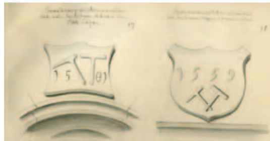
Dessin de Stumpff (19 ème siècle). Il reste encore quelques emblèmes de mineurs sur des linteaux de portes du côté alsacien de Sainte-Marie-aux-Mines.