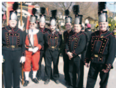
Les membres de la Caisse des Mineurs portent le costume d'apparat des mineurs du 19 ème siècle.

A l'entrée des mines se trouvait aussi la maison du poêle, où les mineurs pouvaient se réchauffer et stocker leur matériel. Lors de fouilles récentes, des carreaux de poêle décorés ont même été retrouvés.