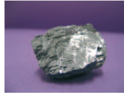
Pépite de galène argentifère (plomb, soufre et 1/1000 e d'argent). Ce minerai était majoritairement présent dans les mines du Val d'Argent.

L'exploration du réseau souterrain a également permis de recenser près de 150 variétés de minéraux qui se distinguent par leur abondance et leur qualité. Le minéralogiste Monnet le souligna déjà vers 1780 : « Les mines de Sainte-Marie-aux-Mines, le val de Lièpvre, où la plus grande partie des mines de ce district se trouvent, auraient suffi seules dans leur temps de splendeur à de grands détails minéralogiques. » Plus d'une trentaine de néoformations* ont été découvertes dont certaines sont uniques au monde (la fluckite, la rauenthalite et la phaunouxite). Une riche collection de minéraux est visible à la Maison de Pays et lors de Euro-Mineral, la bourse internationale aux minéraux.