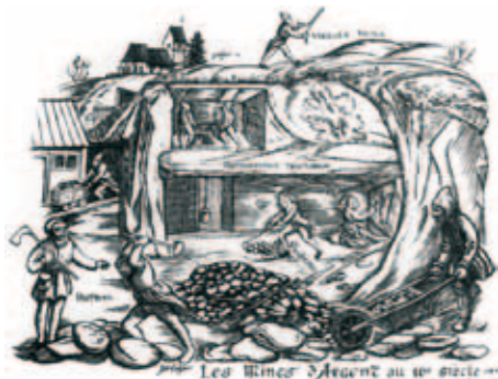
Peinture de R. Gall (mairie de Sainte-Marie-aux-Mines), adaptation d'une gravure du 16 ème siècle de Sébastien Munster.

A la fin du 19 ème siècle se constitue une société par actions allemande. Les premières études de sol semblent témoigner de la présence de riches filons. Aussitôt, les entrepreneurs font construire un vaste complexe minier destiné au traitement des minerais. Mais les perspectives de production ont été largement exagérées : bien vite, les résultats s'avèrent nettement inférieurs aux prévisions. L'entreprise ferme ses portes en 1907. Une dernière tentative a lieu dans les années 1930 à la mine Gabe Gottes où on exploite de l'arsenic à l'état natif*. L'irruption de la 2 ème guerre mondiale précipite sa fermeture en mai 1940, mettant un terme à plus d'un millier d'années d'activité minière.