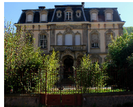
6. Château Lacour rue Clémenceau