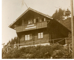
2. Chalet Suisse Côte d'Echey