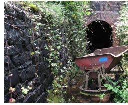
5. Mines du Neuenberg Raenthal