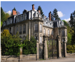
10. Château Burrus rue Maurice Burrus