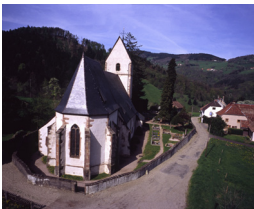
4. Église St Pierre sur l'Hâte