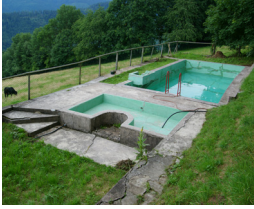
1. Piscine Côte d'Echey