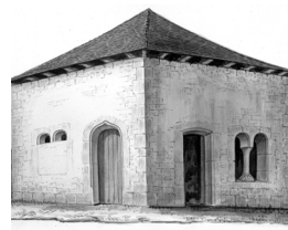
12. Ossuaire rue de l'église