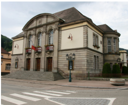
7. Théâtre rue Osmont