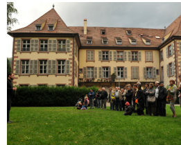
9. Maison Reber rue Reber