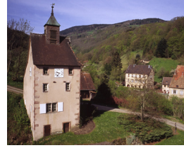
3. Tour des mineurs Echery