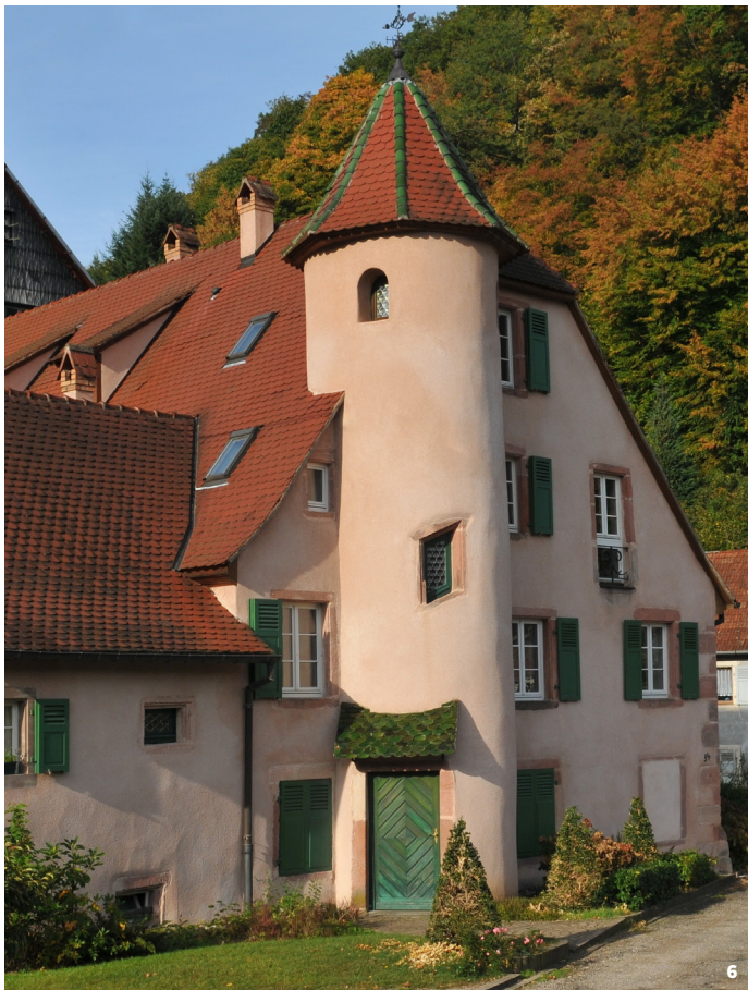
6. Maison du 16 e siècle située à Echery (Sainte-Ma- rie-aux-Mines)